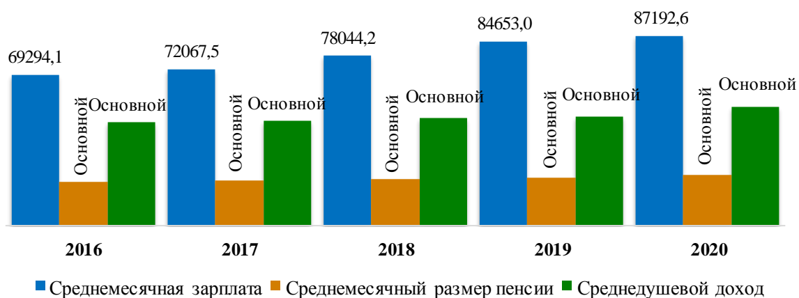
Показатели уровня жизни населения, руб.

Среднемесячный размер трудовой пенсии по старости одного пенсионера по оценке в городе Ханты-Мансийске в 2020 году составил 23 206,5 рубля, или 106,6 % к 2019 году (21 769,7 рубля), без учета доплат из бюджета автономного округа. По данным негосударственного пенсионного фонда Ханты-Мансийского автономного округа – Югры, в 2020 году дополнительные выплаты в среднем составили по 963,3 рубля на 1 человека. С учетом дополнительных выплат средний размер доходов одного неработающего пенсионера в 2020 году составляет 24 159,7 рубля (2019 год – 22 721,72 рубля).